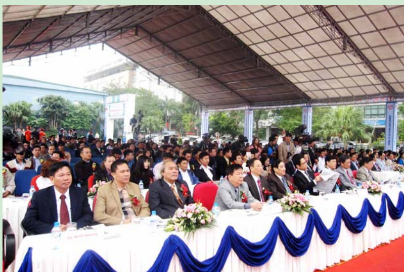
Quang cảnh lễ khai mạc triển lãm