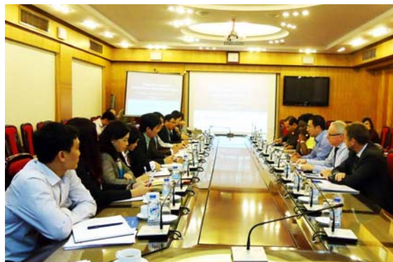
Toàn cảnh buổi tiếp

Theo Bà Victoria Kwakwa, buổi làm việc lần này là cơ hội tốt để hai bên cùng nhau trao đổi các vấn đề liên quan tới ngành nước, đồng thời, tìm ra phương hướng đưa ngành nước của Việt Nam phát triển bền vững. Bà Kwakwa cũng cho rằng, việc chú trọng nhiều hơn tới các doanh nghiệp cấp thoát nước là việc làm cần thiết, bởi những doanh nghiệp này là trung tâm của ngành nước, nhưng làm sao để giúp họ trở thành những doanh nghiệp hiện đại, đáp ứng mọi nhu cầu của người dân, cũng như đảm bảo cung cấp các dịch vụ bền vững trong tương lai, ngoài nhu cầu rất lớn về nguồn vốn, cần thiết phải xây dựng thể chế, chính sách liên quan đến ngành nước thông qua quá trình cải cách, đổi mới doanh nghiệp hoạt động trong lĩnh vực cấp, thoát nước. Về phía WB cam kết hỗ trợ vốn, tuy nhiên, Việt Nam và WB cần phối hợp chặt chẽ để xây dựng các thể chế cũng như