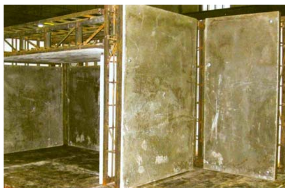
Các liên kết hàn giữa các khối xây có cốt thép với cốt pha không tháo bằng bê tông cốt sợi thép

Vấn đề độ tin cậy của các mối nối giữa các panel trong kết cấu xây dựng - xét về cường độ và độ kín khít (tính thấm nước, không khí) - có thể giải quyết được nếu áp dụng công nghệ lắp ghép liên khối đối với công trình/ nhà ở xây khung. Trong trường hợp này, các cột, dầm, khung của sàn và các tấm ngăn của cốt pha không tháo thông thường cũng như cốt pha bê tông cốt thép ứng lực trước được chế tạo sẵn trong các nhà máy. Tại công trình, công nhân chỉ cần thao tác lắp ghép và đổ bê tông vào các tấm sàn, làm liền khít các khớp nối giữa các dầm khung và cột. Bằng cách này, bài toán về cường độ và độ kín khít của các mối nối được