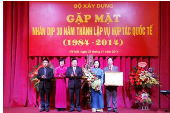
Bộ trưởng Trịnh Đình Dũng thừa ủy quyền của Chủ tịch nước trao Huân chương Lao động hạng Ba cho Vụ Hợp tác quốc tế

Bước ngoặt bắt đầu từ những năm đầu thập niên 1990, đặc biệt là năm 1993 sau Hội nghị bàn tròn cho Việt Nam khởi động lại nguồn vốn