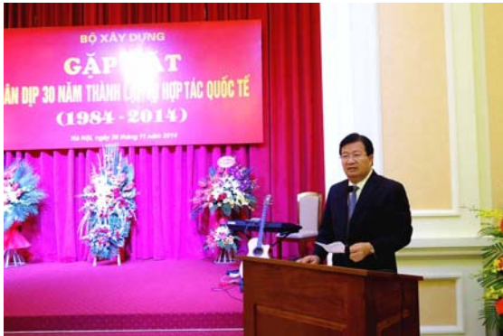
Bộ trưởng Bộ Xây dựng Trịnh Đình Dũng phát biểu tại buổi Lễ

Trịnh Đình Dũng đã đến dự và chia vui với Vụ Hợp tác quốc tế.