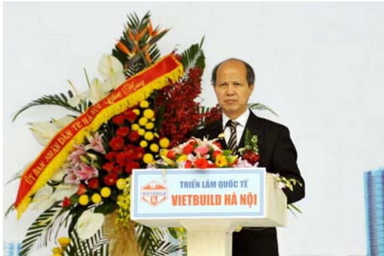
Thứ trưởng Bộ Xây dựng Nguyễn Trần Nam phát biểu khai mạc Triển lãm

Trần Nam cho biết: Triển lãm Quốc tế Vietbuild 2014 lần thứ 2 tại Hà Nội diễn ra khi tình hình kinh tế của đất nước trong 10 tháng đầu năm 2014 tiếp tục đà phục hồi ở tất cả các ngành, lĩnh vực chủ yếu; tăng trưởng GDP đạt cao hơn cùng kỳ 2 năm trước (Tăng trưởng GDP 9 tháng đầu năm trước đạt 5,62%); lạm phát được kiểm soát; chỉ số giá tiêu dùng (CPI) tháng 10 tăng 0,11% so với tháng trước, so với tháng 12/2013, chỉ số giá tiêu dùng tháng 10 có mức tăng thấp nhất so với cùng kỳ 11 năm qua. Trong hoạt động xây dựng, những tháng cuối năm là thời điểm bước vào mùa xây dựng, do đó, sản lượng xây lắp đã tăng lên kéo theo vật liệu xây dựng, trong đó có tiêu thụ xi măng đã tăng so với những tháng trước. Trong lĩnh vực Bất động sản, do lãi suất ngân hàng tiếp tục giảm, tỷ giá, thị trường ngoại hối ổn định, chính sách của Nhà nước về hỗ trợ ngành bất động sản đã và đang phát huy tác dụng cùng với những điều kiện cho vay mua nhà được nới lỏng nên hoạt động kinh doanh bất động sản tiếp tục được cải thiện với mức tăng cao hơn cùng kỳ năm trước.