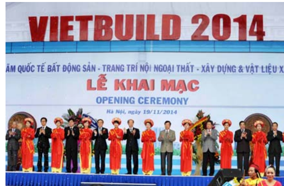
Quang cảnh Lễ khai mạc Triển lãm

Tại Lễ khai mạc, Ban tổ chức đã trao giải Gian hàng quy mô - đẹp và ấn tượng. Hầu hết các sản phẩm được trưng bày tại Triển lãm Vietbuild Hà Nội lần này đã được các doanh nghiệp tìm hiểu, nghiên cứu và đầu tư sản xuất với mẫu mã, tính năng và chất lượng được nâng cao, đáp ứng nhu cầu xây dựng, trang trí nội